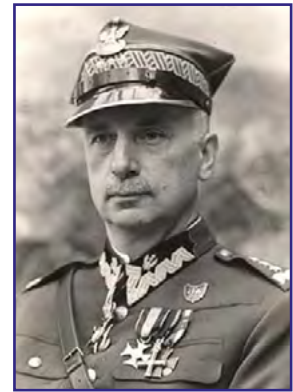
gen. Kazimierz Sosnkowski

„Z nie byle jakim cynizmem sprzedano w Jałcie na rzecz Rosji krew polską przelaną w powstaniu warszawskim i wkład Polskich Sił Zbrojnych do zwycięstwa nad Niemcami” – pisał po latach Naczelny Wódz gen. Kazimierz Sosnkowski o konferencji jałtańskiej.