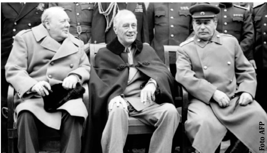
Winston Churchill, Franklin D. Roosevelt i Józef Stalin